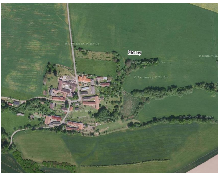
Situace zanášené nádrže

Zanášení nádrže jemnými sedimenty z polí – nádrž neplní svůj účel; výhledově nutná revitalizace nádrže.