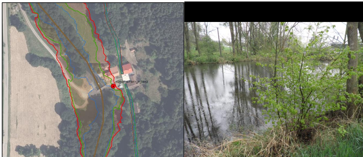
Obrázek 5-5: Situace záplavového území a foto ohroženého místa (CERCANSKY_P_0014)

Při vyšších průtocích může dojít k přelití rybníku u trati, ul. Nádražní, a zaplavení viaduktu pod železnicí.