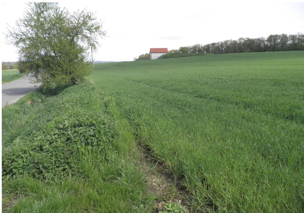
Svažité pole nad obcí Žižánky

Přívalové deště a splachy z polí + nekapacitní strouha.