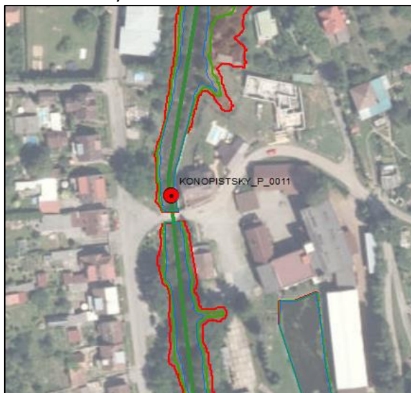
Obrázek 5-1: Situace záplavového území a foto ohroženého místa (BENESOVSKY_P_0011)

Potenciální ohrožení říčními povodněmi na soutoku Benešovského a Okrouhlického potoka – dvou zhruba stejně velkých potoků s obdobnými Q_N .