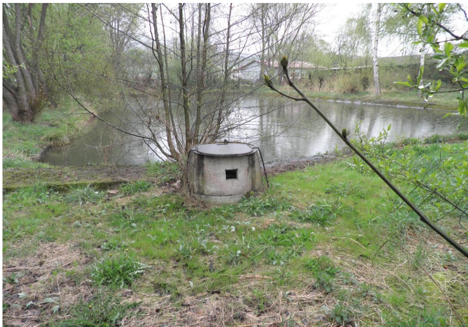
Nevyužitá bývalá požární nádrž - vhodná k revitalizaci

Přívalové deště a splachy z polí – nevyužitá bývalá požární nádrž u Čerčanského potoka (majetek obce) neplní svůj účel; výhledově nutná revitalizace nádrže a vlastního toku – architektonická studie již zpracována.