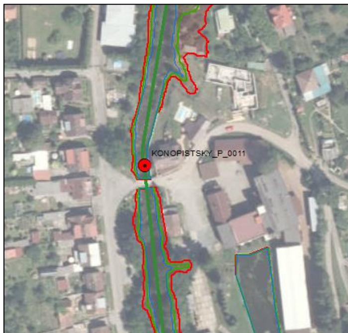
Obrázek 5-3: Situace záplavového území a foto ohroženého místa (BENESOVSKY_P_0013)

Ohrožení říčními povodněmi z Benešovského potoka - průmyslový areál u Medunského potoka.