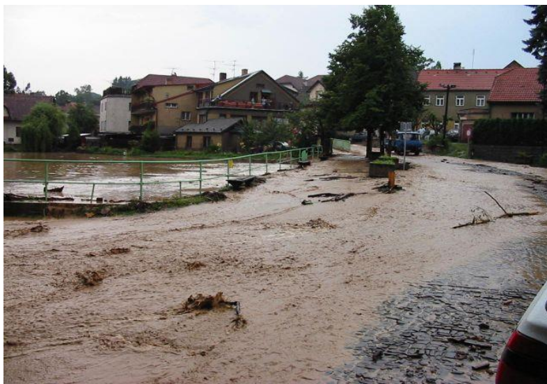
Vybřežení toku na náves a přes návesní rybník v roce 2002.

V obci je nejproblematictější tokem Oborský potok, který je pravostranným přítokem Sázavy. Horní část povodí pokrývají pole. Střední a dolní část je lesnatá. Ve střední části toku cca 1 km nad obcí jsou vrty, ze kterých je čerpána voda do obecního vodovodu. Problematickým úsekem je poslední část toku před ústím do Sázavy. Tok je při průchodu obcí z větší části zatrubněn a kapacita zatrubnění je nedostatečná a rozlivu do obce dochází často.