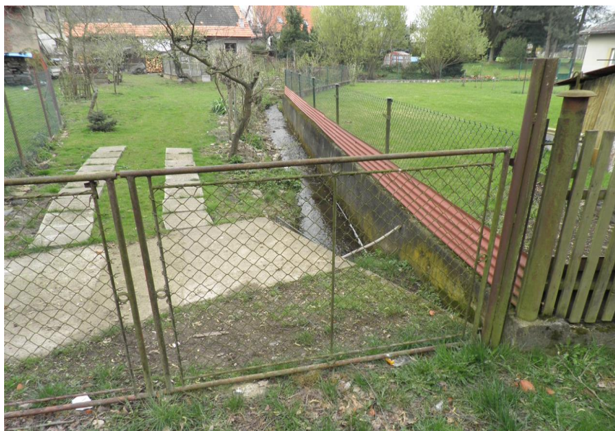
Koryto Břežanského potoka v horní části obce Břežany

Problém kritického bodu tvoří kombinace průtoku ve vstupním profilu do obce - až 8 m 3 /s při Q 20 s relativně málo kapacitním korytem obce, jehož kapacita je v mnoha úsecích omezována nevhodně instalovanými objekty a umělým trasováním toku. Horní část povodí pokrývají pole, z 20% lesy.